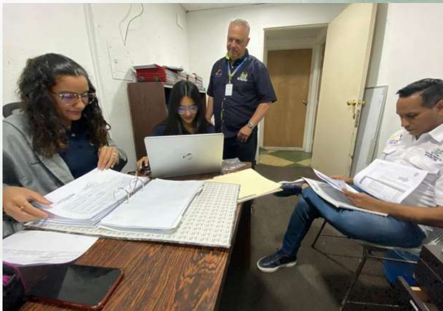
Auditoría operativa en la Dirección de Administración del Concejo de la municipalidad.