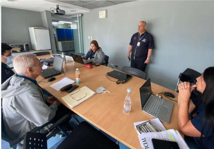
Examen de la cuenta en la Dirección de Tesorería y Finanza, de la Alcaldía del Municipio Baruta.

Siguiendo los lineamientos del Contralor General de la República, Dr. Elvis Amoroso, la Contraloría municipal de Baruta, a través de sus auditores de la Dirección de Control Posterior iniciaron este año 2023, auditorías a los entes sujetos a supervisión por este Órgano de Control Fiscal Externo, en aras de continuar en la lucha anticorrupción.